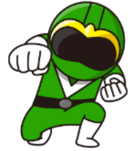
ミドレンジャー 担当：カビ・コケ